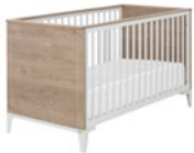
IP2A602 (chêne blond-Blanc) IP3A602 (chêne blond-Noir) Lit bébé (1)

Il sommier à lattes réglable 2 positions. 2 barrières fixes 1 position. finition blanche ou noire. L 74 x H 84 x P 150 cm