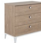
IP2A160(chêne blond-Blanc) IP3A160 (chêne blond-Noir) Commode 3 tiroirs Fixation murale recommandée. L 95 x H 91 x P 46 cm