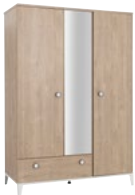
IP2A180(chêne blond-Blanc) IP3A180 (chêne blond-Noir) Armoire 3 portes 1 tiroir 1/2 penderie (2 tubes), 1/2 lingère verre argenté avec film anti-bris sur porte centrale. L 136 x H 195 x P 58 cm