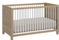
IP3J602 Lit bébé (1)

Il sommier à lattes, réglable 2 positions 2 barrières fixes 1 position Sans matelas 70x40. L 145 x H 84 x P 74 cm